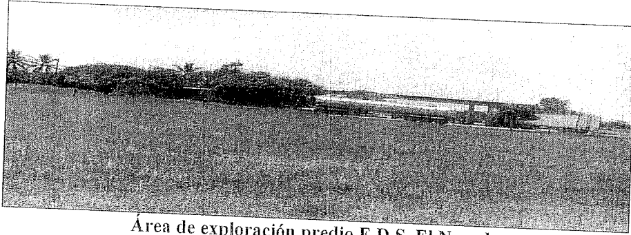
Área de exploración predio E.D.S. El Nevado

El sitio donde se tiene previsto la exploración de aguas subterráneas se encuentra en un predio ubicado en la zona rural del municipio de Pelaya denominado Estación de Servicio El Nevado, está ubicado en el kilómetro 7 costado derecho de la vía La Mata-San Roque, cuyos linderos están consignados en la matrícula inmobiliaria No. 192-23869 (folios 6 y 7), en jurisdicción del municipio de Pelaya Cesar, teniendo este una extensión superficial de 1 Ha.