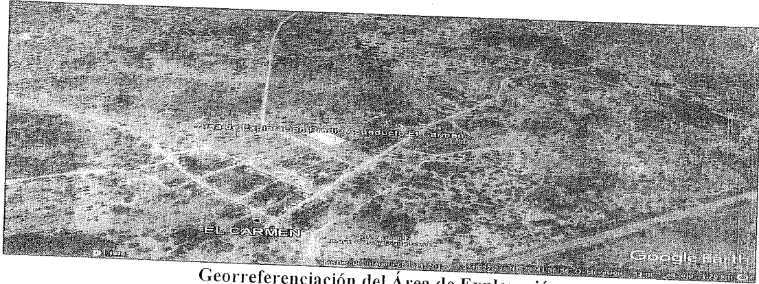
Georreferenciación del Área de Exploración