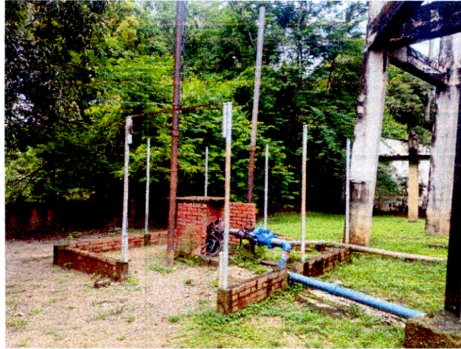
Ilustración 3. Pozo No. 3

Continuación Auto No 0841 de 12 AGO 2022 MEDIO DEL CUAL SE INICIA UN PROCESO SANCIONATORIO DE CARACTER AMBIENTAL EN CONTRA DEL MUNICIPIO DE TAMALAMEQUE – CESAR, CON IDENTIFICACIÓN TRIBUTARIA NO. 800.096.626 Y DE LA EMPRESA DE SERVICIOS PÚBLICOS DEL MUNICIPIO DE TAMALAMEQUE – EMSEPTA S.A.S., CON IDENTIFICACIÓN TRIBUTARIA NO. 800.096.626 – 4; POR PRESUNTA INFRACCIÓN A LA NORMATIVIDAD AMBIENTAL Y SE ADOPTAN OTRAS DISPOSICIONES.”