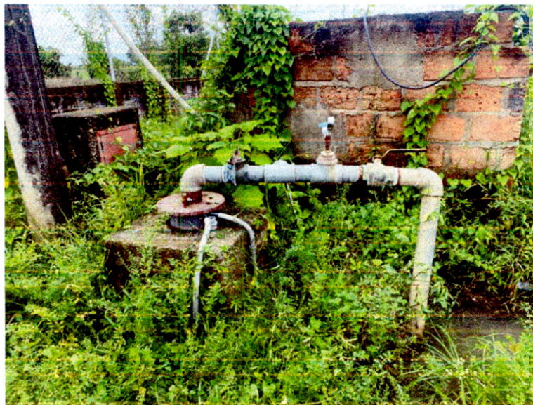
Ilustración 4. Pozo Antequera