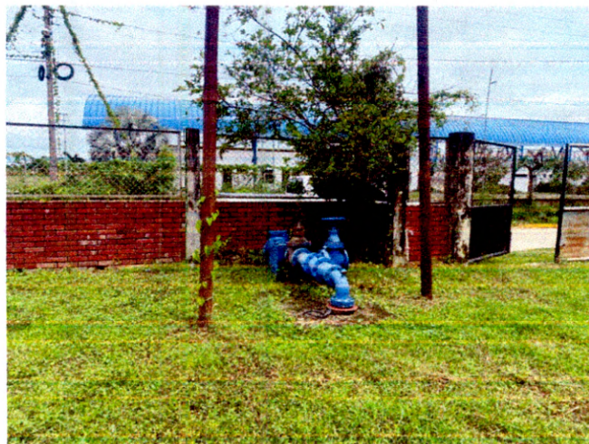
Ilustración 2. Pozo No. 2