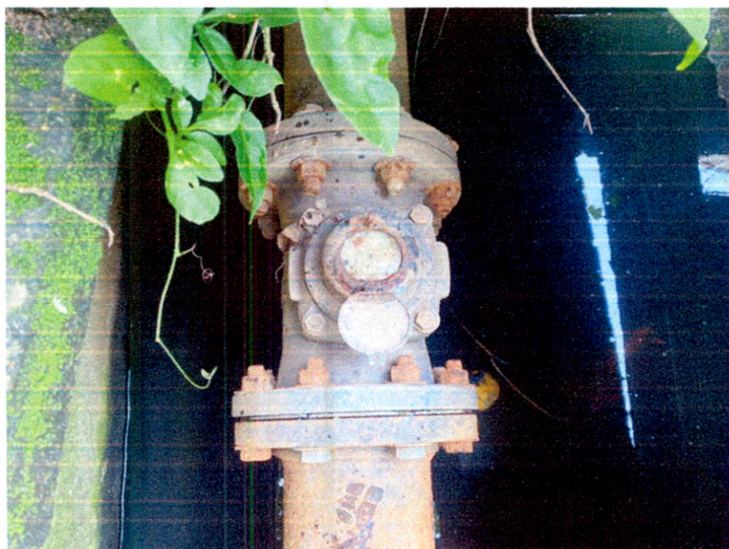
Ilustración 5. Medidor de caudal fuera de servicio del Pozo No. 3

En la diligencia de inspección se evidenció que el Pozo No. 3 tiene instalado un medidor de caudal a la salida pero este no se encuentra en funcionamiento y posee el talco visor empañado. Los Pozos No. 1 y No. 2, no tienen instalado medidor de caudal.