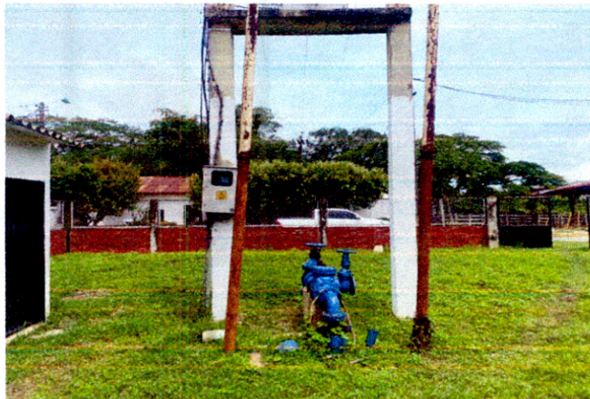
Ilustración 1. Pozo No. 1