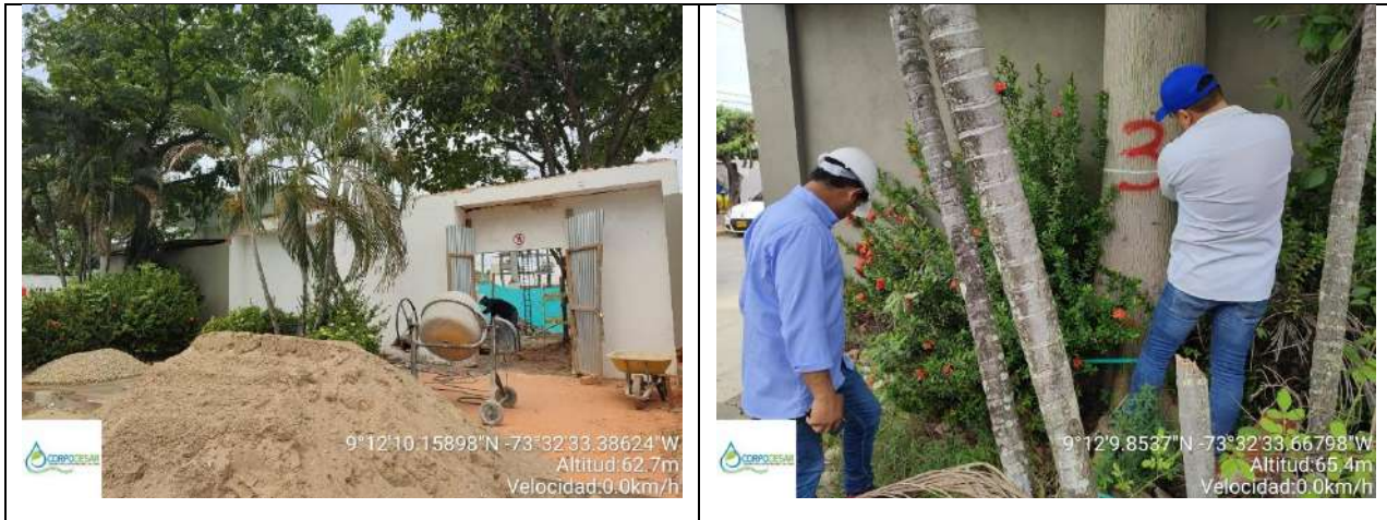
Foto No 1, vista frontal del predio de la sede de CARIBEMAR DE LA COSTA S.A.S E.S.P. – AFINIA y foto N° 2 árbol de la especie Ceiba (Ceiba pentandra) para intervenir con tala, ya que interfieren en las obras proyectadas.