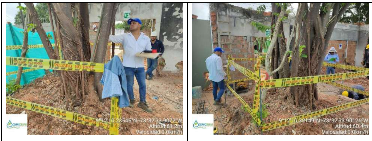
Fotos 3 y 4 árboles de la especie Suan (Ficus sp) y Mora (Maclura tinctoria) para intervenir con tala, ya que dada su ubicación interfieren en las obras proyectadas..