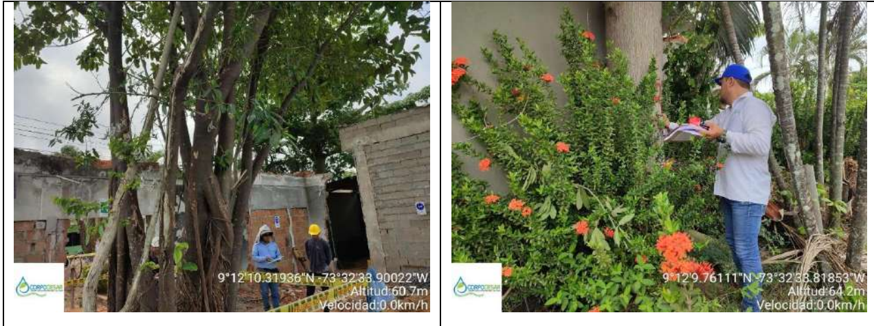
Fotos 5 y 6 árboles para intervenir con tala, ya que dada su ubicación y estado amerita ser erradicado.

Continuación Resolución No. 008 del 13 de marzo de 2024, "Por medio de la cual se otorga Autorización a CARIBEMAR DE LA COSTA S.A. E.S.P. con identificación tributaria No. 901.380.949-1, para realizar la tala de tres (3) árboles de las especies comúnmente conocidas como Suan (Ficus sp), Mora (Maclura tinctoria) y Ceiba (Ceiba pentandra), ubicados en la Calle 10 con Carrera 16 Barrio El Paraíso del municipio de Curumani Cesar".