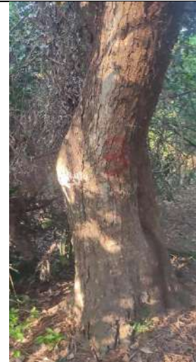
Fotografía 7 y 8 árboles de la especie Campano (Samanea Samán), ubicado en la Finca Parcela 80 ubicado en la vereda Madre vieja en jurisdicción del Municipio de Chiriguana – Cesar.