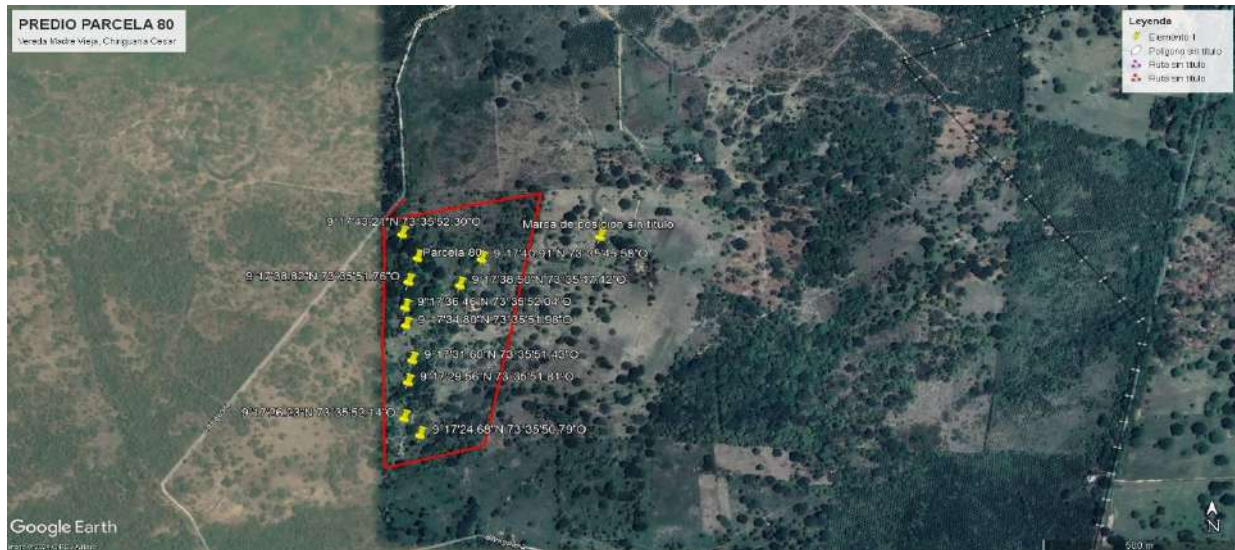
Imagen 1 Predio Parcela 80