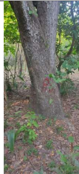
Fotografía 1 y 2 árboles de la especie Campano ( Samanea Samán ), ubicado en la Finca Parcela 80 ubicado en la vereda Madre vieja en jurisdicción del Municipio de Chiriguana – Cesar.