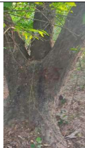
Fotografía 21 y 22 árboles de la especie Campano (Samanea Samán), ubicado en la Finca Parcela 80 ubicado en la vereda Madre vieja en jurisdicción del Municipio de Chiriguana – Cesar.