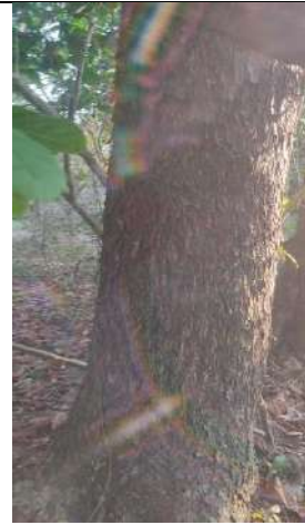
Fotografía 15 y 16 árboles de la especie Campano (Samanea Samán), ubicado en la Finca Parcela 80 ubicado en la vereda Madre vieja en jurisdicción del Municipio de Chiriguana – Cesar.