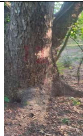
Fotografía 9 y 10 árboles de la especie Campano (Samanea Samán), ubicado en la Finca Parcela 80 ubicado en la vereda Madre vieja en jurisdicción del Municipio de Chiriguana – Cesar.