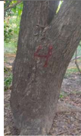
Fotografía 11 y 12 árboles de la especie Campano (Samanea Samán), ubicado en la Finca Parcela 80 ubicado en la vereda Madre vieja en jurisdicción del Municipio de Chiriguana – Cesar.