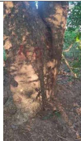
Fotografía 17 y 18 árboles de la especie Campano (Samanea Samán), ubicado en la Finca Parcela 80 ubicado en la vereda Madre vieja en jurisdicción del Municipio de Chiriguana – Cesar.