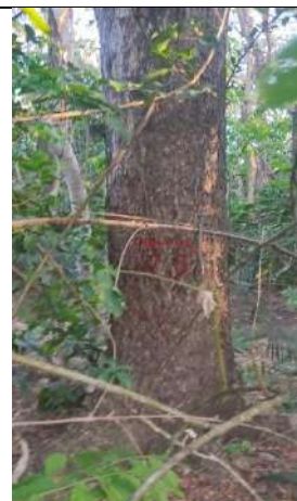
Fotografía 19 y 20 árboles de la especie Campano (Samanea Samán), ubicado en la Finca Parcela 80 ubicado en la vereda Madre vieja en jurisdicción del Municipio de Chiriguana – Cesar.