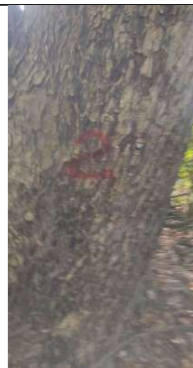
Fotografía 3 y 4 árboles de la especie Campano (Samanea Samán), ubicado en la Finca Parcela 80 ubicado en la vereda Madre vieja en jurisdicción del Municipio de Chiriguana – Cesar.