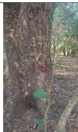
Fotografía 5 y 6 árboles de la especie árboles de la especie Campano (Samanea Samán), ubicado en la Finca Parcela 80 ubicado en la vereda Madre vieja en jurisdicción del Municipio de Chiriguana – Cesar.