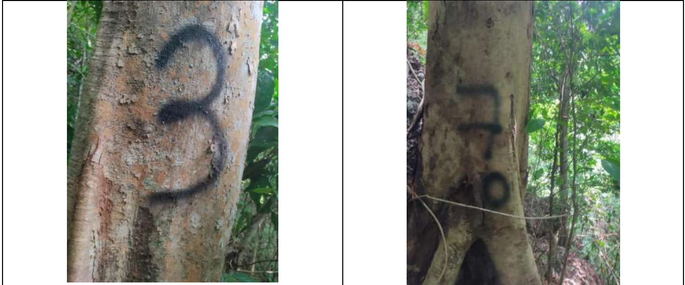
Fotografía 15 y 16 árboles de la especie campano (samanea samán), ubicados en el predio denominado Villa Nelly en el corregimiento de Sabanagrande en jurisdicción del Municipio de Curumani – Cesar.