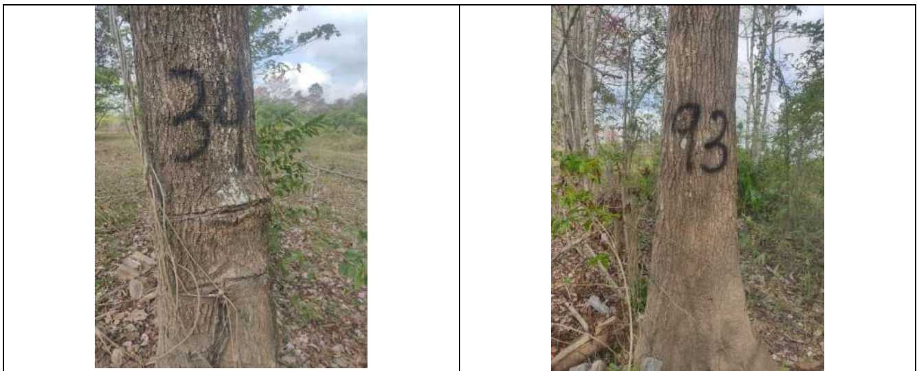
Fotografía 5 y 6 árboles de la especie Roble ( Tabebuia rosea ), ubicados en el predio denominado Villa Nelly en el corregimiento de Sabanagrande en jurisdicción del Municipio de Curumani – Cesar.