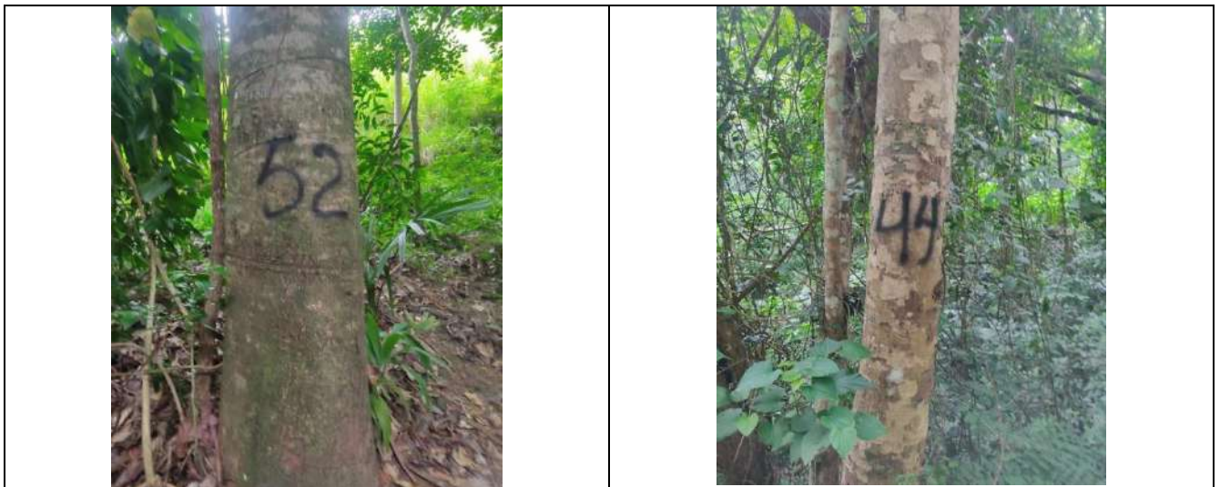
Fotografía 17 y 18 árboles de la especie campano (samanea samán), ubicados en el predio denominado Villa Nelly en el corregimiento de Sabanagrande en jurisdicción del Municipio de Curumani – Cesar.