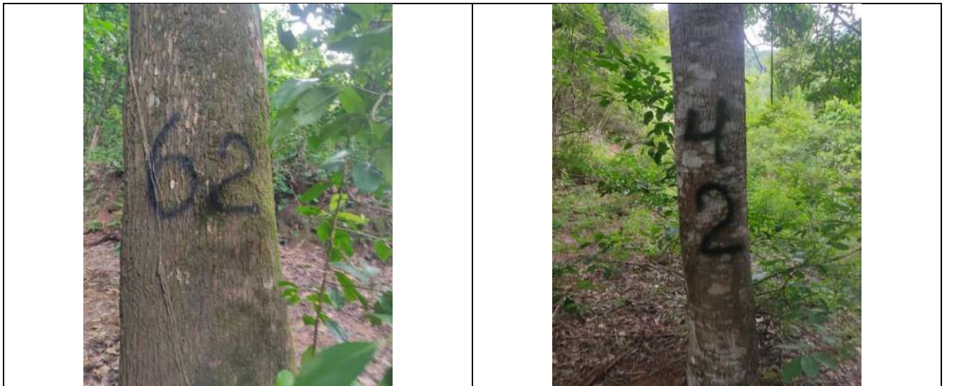
Fotografía 21 y 22 árboles de la especie campano (samanea samán), ubicados en el predio denominado Villa Nelly en el corregimiento de Sabanagrande en jurisdicción del Municipio de Curumani – Cesar..