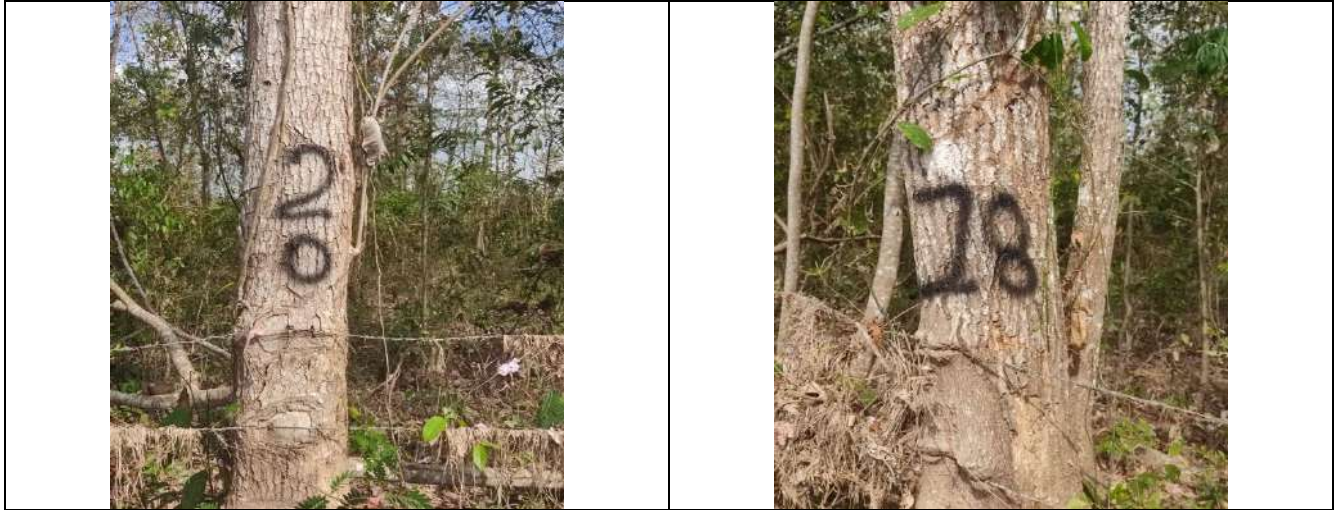
Fotografía 3 y 4 árboles de la especie Roble ( Tabebuia rosea ), ubicados en el predio denominado Villa Nelly en el corregimiento de Sabanagrande en jurisdicción del Municipio de Curumani – Cesar.