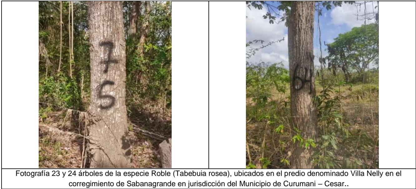
Imagen 1. Predio Villa Nelly ubicado en el corregimiento de Sabanagrande jurisdicción del municipio de Curumani.