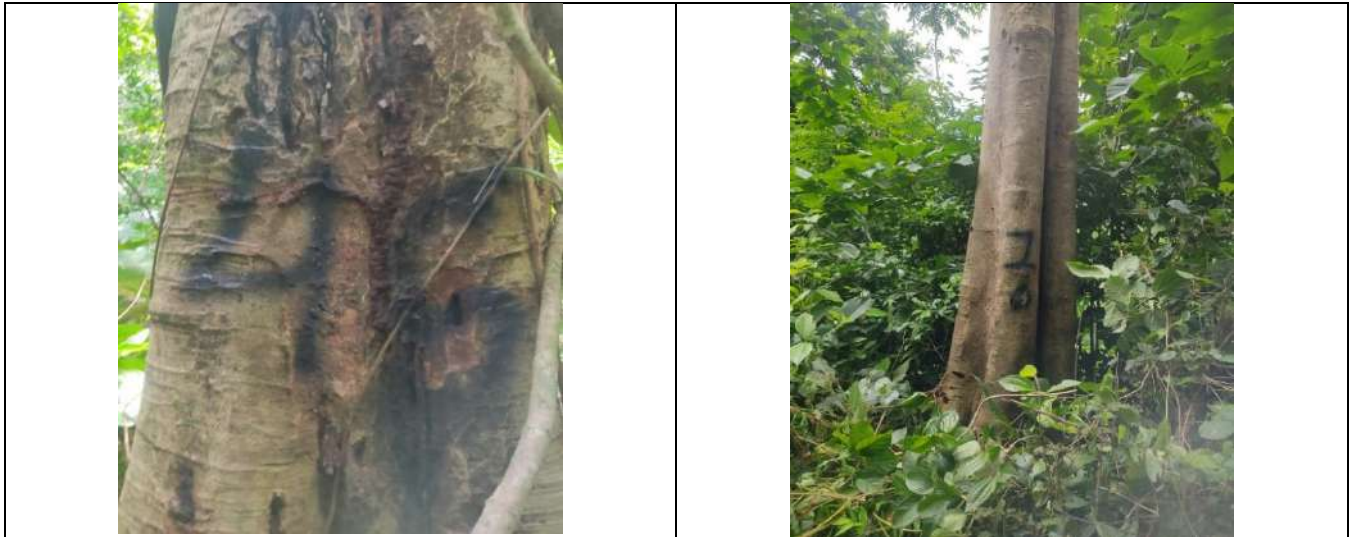
Fotografía 19 y 20 árboles de la especie campano (samanea samán), ubicados en el predio denominado Villa Nelly en el corregimiento de Sabanagrande en jurisdicción del Municipio de Curumani – Cesar.