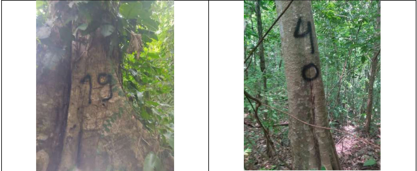
Fotografía 11 y 12 árboles de la especie campano (samanea samán), ubicados en el predio denominado Villa Nelly en el corregimiento de Sabanagrande en jurisdicción del Municipio de Curumani – Cesar.