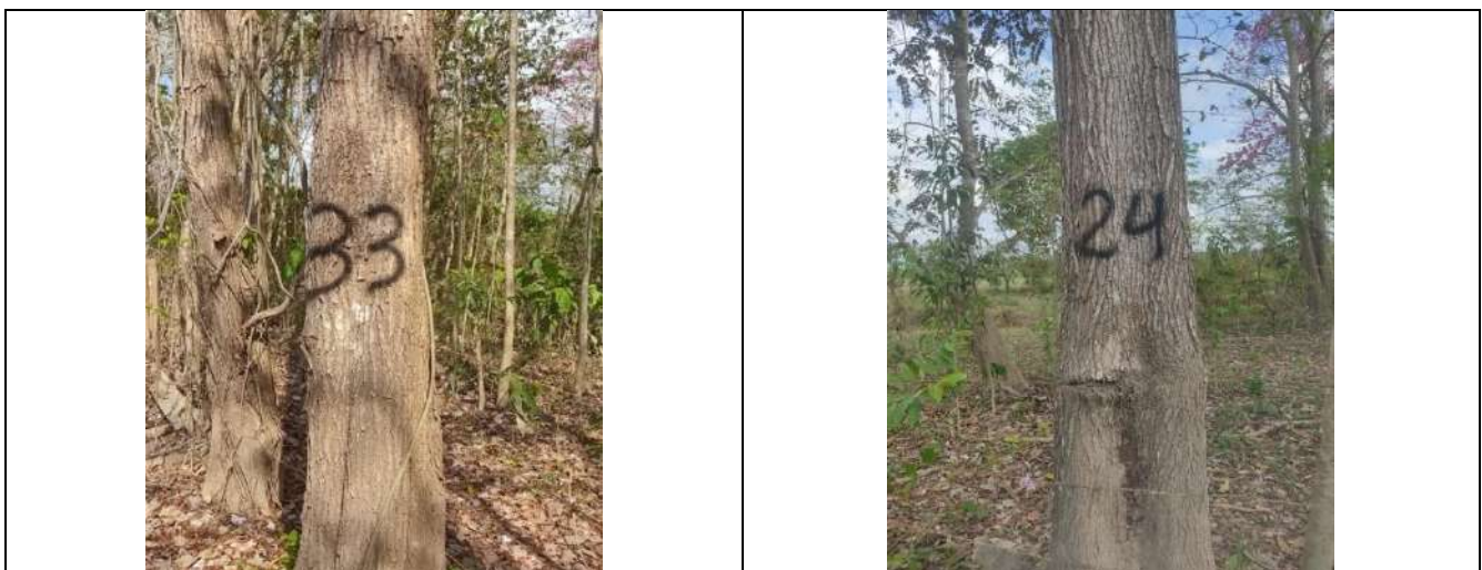
Fotografía 9 y 10 árboles de la especie Roble (Tabebuia rosea), ubicados en el predio denominado Villa Nelly en el corregimiento de Sabanagrande en jurisdicción del Municipio de Chiriguana – Cesar.