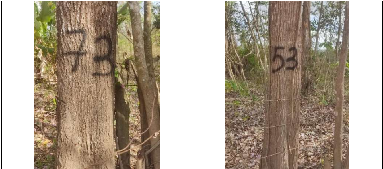
Fotografía 7 y 8 árboles de la especie Roble (Tabebuia rosea), ubicados en el predio denominado Villa Nelly en el corregimiento de Sabanagrande en jurisdicción del Municipio de Curumani – Cesar.