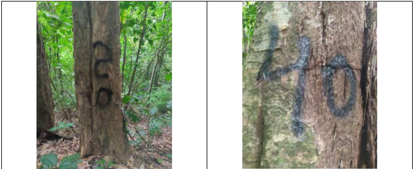
Fotografía 13 y 14 árboles de la especie campano (samanea saman), ubicados en el predio denominado Villa Nelly en el corregimiento de Sabanagrande en jurisdicción del Municipio de Curumani – Cesar.