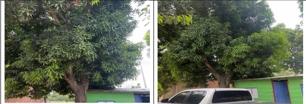
Imagen No 3 y 4 de la especie Mango ( Manguifera indica ) para intervenir con tala, ya que dada su ubicación y de acuerdo al tamaño que presenta representa un riesgo de caer sobre el predio