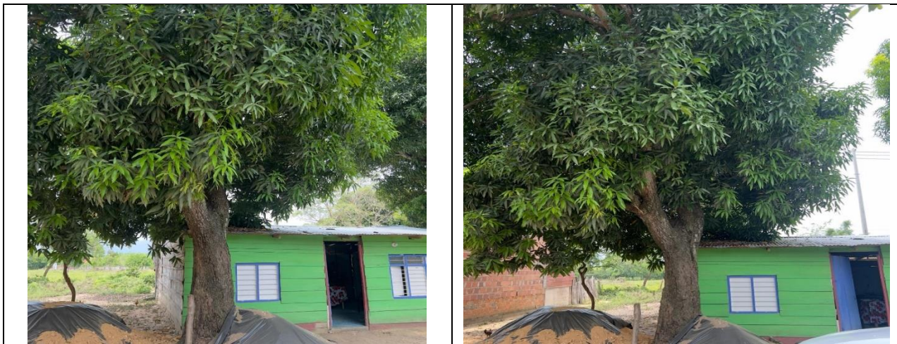
Imagen No 1 y 2 de la especie Mango ( Manguifera indica ) para intervenir con tala, ya que dada su ubicación y de acuerdo al tamaño que presenta representa un riesgo de caer sobre el predio del usuario.