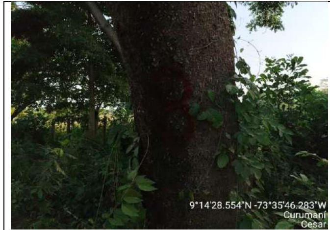
Árboles No 8 de la especie Orejero ( enterolobium ciclocarpum ) para intervenir con tala, ya que interfieren en las obras y actividades del proyecto "Pavimentación En Rígido vía al corregimiento de El Mamey – Curumaní – Cesar".

Continuación Resolución No 021 del 16 de abril de 2024, "Por medio de la cual se otorga permiso al MUNICIPIO DE CURUMANI , con identificación Tributaria No.800.096.580-4, para efectuar intervención forestal sobre árboles aislados ubicados en la vía al corregimiento de El Mamey zona rural jurisdicción del municipio de Curumaní - Cesar, para el proyecto "PAVIMENTACION EN RIGIDO VIA AL MAMEY.