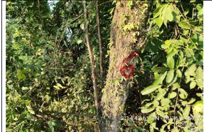
Árboles No 4 de la especie Guasimo (guasimela acuchipela) para intervenir con tala, ya que interfieren en las obras y actividades del proyecto "Pavimentación En Rígido vía al corregimiento de El Mamey – Curumaní – Cesar".