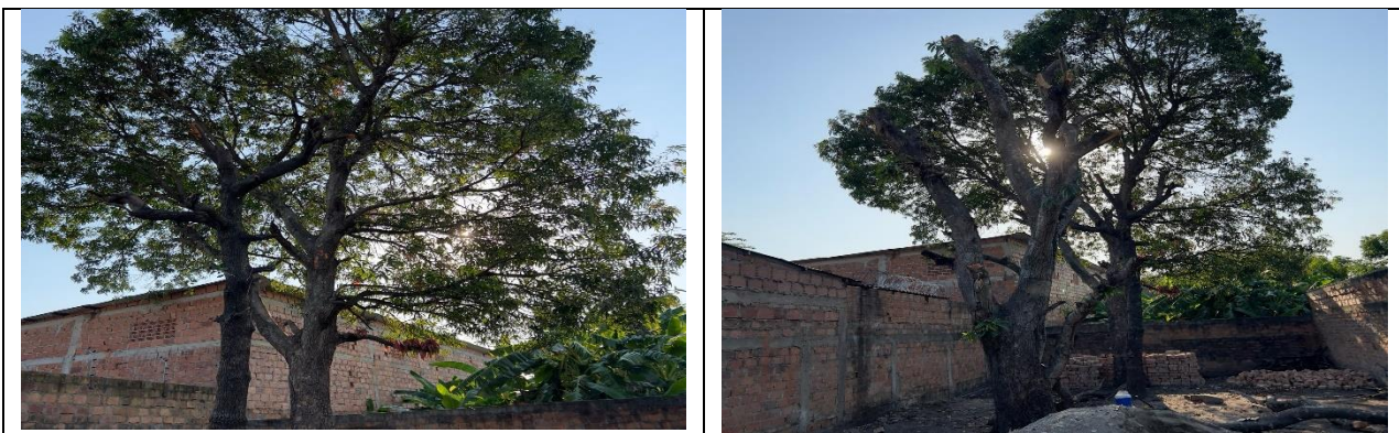
Fotos No 1 y 2 árboles de la especie Mango ( Manguifera indica ) para intervenir con tala, ya que dada su ubicación y de acuerdo al tamaño que presenta constituye un riesgo y afectan los techos y viviendas aledañas.