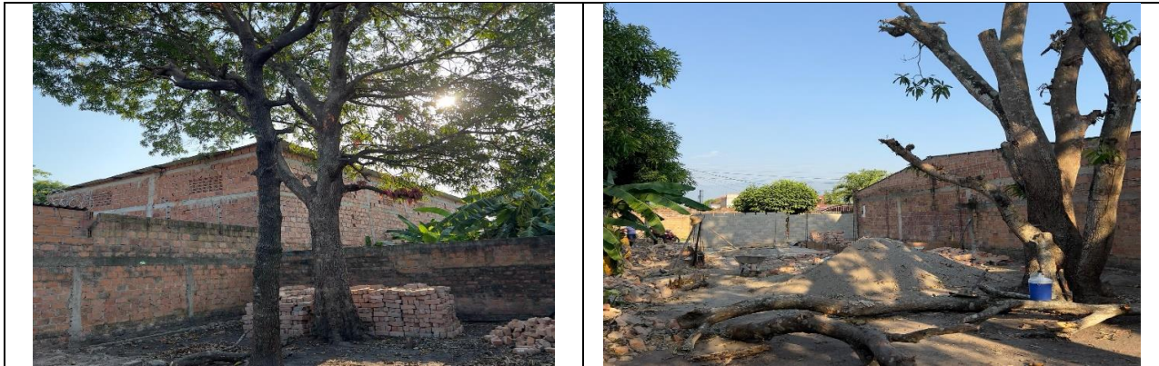
Fotos No 3 y 4 árboles de la especie Mango ( Manguifera indica ) para intervenir con tala, ya que dada su ubicación y de acuerdo al tamaño que presenta constituye un riesgo y afectan los techos y viviendas aledañas.