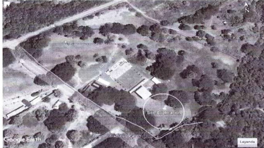
Imagen 2. Localización área de exploración