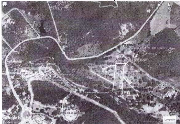
Imagen 1. Localización predio.