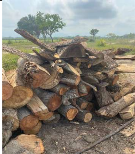
Fotografía 3 y 4 montones de leña la especie Orejero ( Enterolobium cyclocarpum ), ubicados en el predio denominado Villa Carmen, ubicado en la vereda El Mamey en jurisdicción del Municipio de Curumani – Cesar.