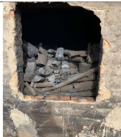
Fotografía 7 y 8 hornos en prueba para la quema de los residuos ubicados en el predio denominado Villa Carmen, ubicado en la vereda El Mamey en jurisdicción del Municipio de Curumani – Cesar