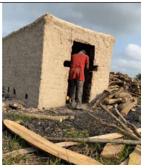
Fotografía 5 montones de leña la especie Campano (Samanea Samán), fotografía 6 cargado de los hornos ubicados en el predio denominado Villa Carmen, ubicado en la vereda El Mamey en jurisdicción del Municipio de Curumani – Cesar.