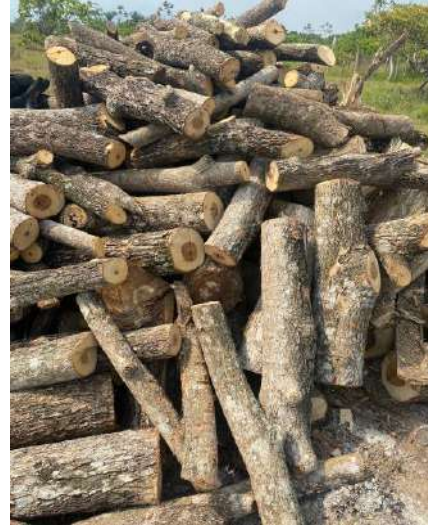
Fotografía 1, 2 montones de leña la especie Campano ( Samanea Samán ), ubicados en el predio denominado Villa Carmen, ubicado en la vereda El Mamey en jurisdicción del Municipio de Curumani – Cesar.