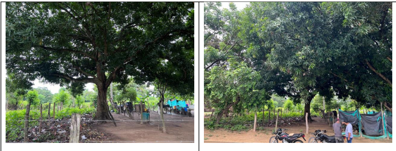
Tabla 1 Especies y cálculo de volúmenes de los árboles a intervenir con tala en la Vía San Pedro detrás de la Urbanización Sara Lucia del Municipio de Curumani – Cesar.