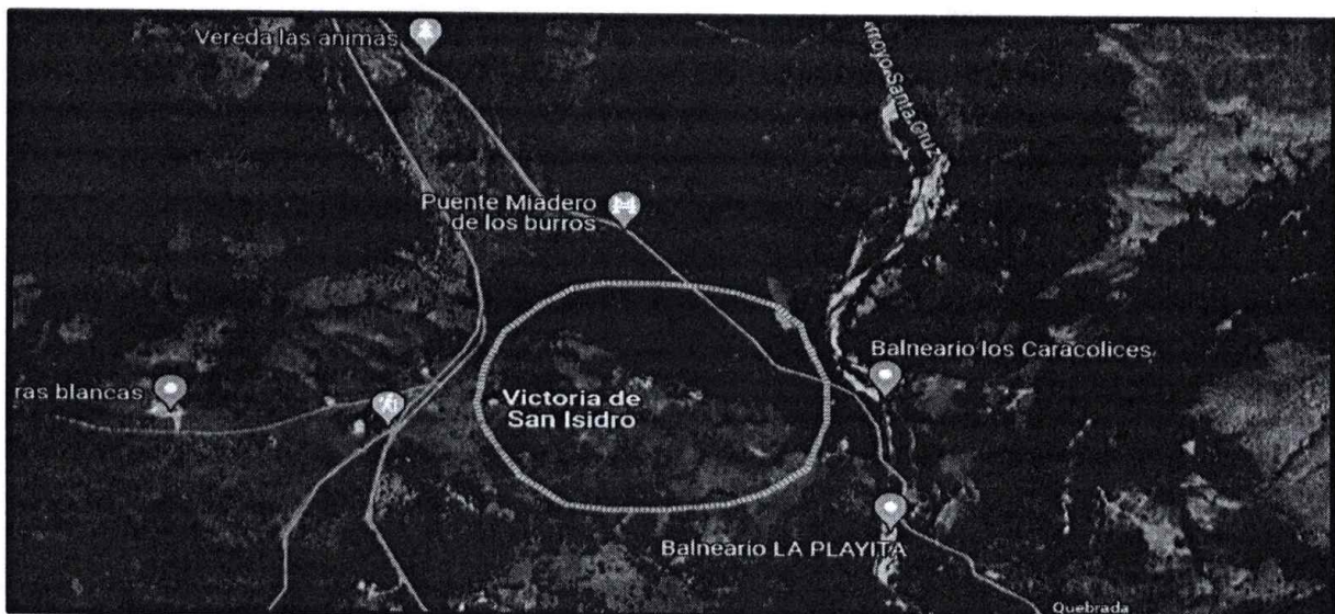
Imagen 1 – Imagen satelital de la Victoria de San Isidro Cesar

En cumplimiento a lo solicitado por la Oficina Jurídica de CORPOCESAR, se realizó desplazamiento a La Victoria de San Isidro – Cesar, donde se logra identificar lo siguiente: