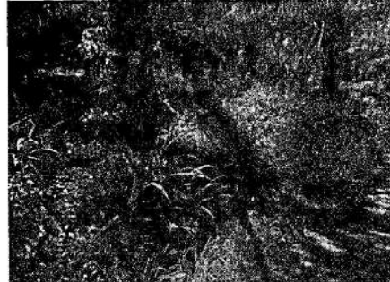
Imagen 2: Área de exploración