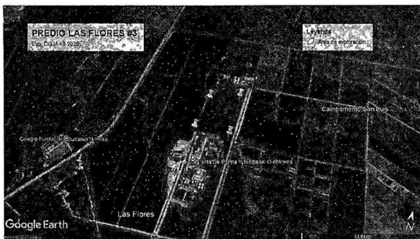
Imagen 3. Georreferenciación del Área de exploración

Acorde a lo indicado por el peticionario, éste solicita un plazo de un (1) año para realizar la exploración y así prever cualquier imprevisto y de esta forma evitar reiteración de trámites.