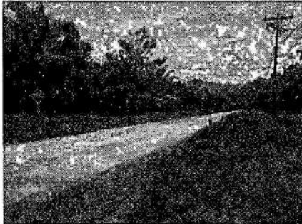
Imagen 1: Vía de acceso al predio La Flores #3

El predio Las Flores #3 de matrícula inmobiliaria No 190-5184, se ubica en el municipio de La Paz Cesar, y consta de 1100 Has 8400 mts 2 de extensión superficial según se desprende del certificado de Tradición y Libertad, de fecha 18 de junio de 2025.