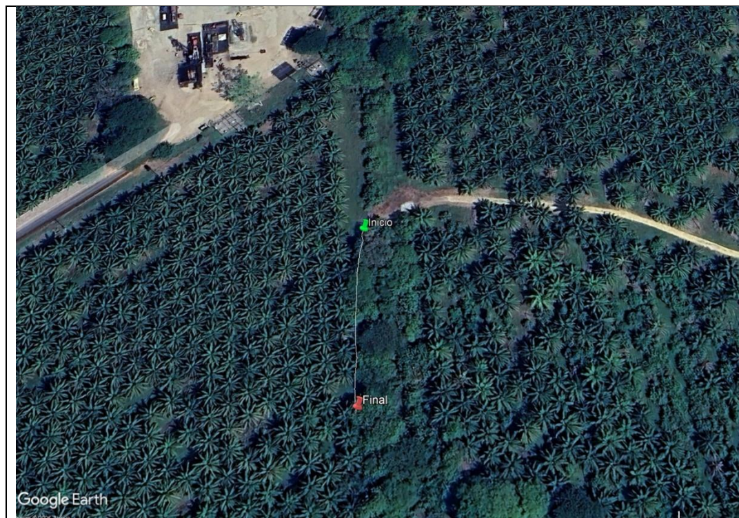
IMAGEN 5 Ubicación geografica del predio donde se encuentran los árboles.