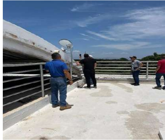
VISITA DE INSPECCION OCULAR A LOS SISTEMAS FOTOVOLTAICOS (PANELES SOLARES) DE LA CORPORACION