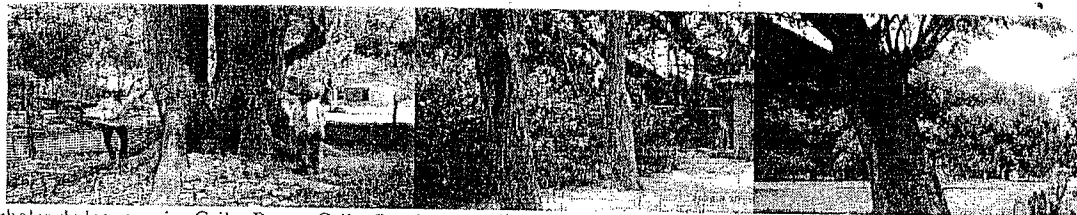
Arboles de las especies Ceiba Bonga Ceiba Pentandra , Carreto Aspidosperma polyneuron y Orejeo o Carito Enterolobium Cyclocarpum , objetos de aprovechamiento forestal.