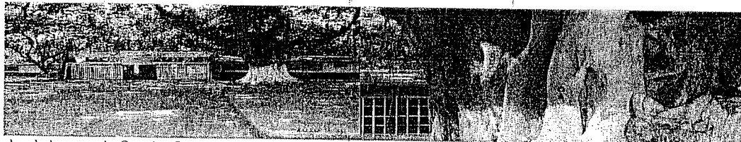
Arboles de la especie Caucho Cartagenero Ficus sp. , ubicados en la entrada de la feria ganadera, los cuales serán excluidos del permiso de Aprovechamiento Forestal a consideración de los evaluadores.