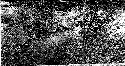
Canal proveniente de los Sobrantes de la Planta de Emdupar.

Durante la diligencia técnica de control y seguimiento ambiental, se pudo evidenciar canal en tierra totalmente seco, cabe manifestar que no se observó ningún tipo de cultivo que requiera el recurso hídrico para riego, ni se evidencia trazado o derivación de canales para tal fin.