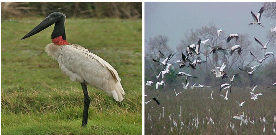
Figura 11. Guroyon y coñongos asociados con otras especies de aves en áreas de inundación.

Las poblaciones de aves reportadas muestran claramente migraciones de poblaciones locales desde la cuenca baja, hacia la cuenca media del río Cesar principalmente en búsqueda de alimento muchas de ellas consideradas en los libros rojos o Cites ( Jabiru mycteria , Cairina mostacha , Mycteria americana , Dendrocygna autumnalis , Dendrocygna bicolor ), estas son especies gregarias que se reúnen en cuerpos de aguas con niveles bajos principalmente de áreas inundables. Los cultivos que requieren inundación de áreas incrementa la presencia de estas especies en esos sitios constituyéndose en pérdida para los agricultores principalmente de arroz pero a su vez las practicas utilizadas para controlarlas además de atender contra la diversidad y violar la legislación existente (Ley 99, Código de los Recursos Naturales, Convenio sobre Biodiversidad, Convenio Ramsar entre otros), impactan sobre otros recursos (Ecoturismo), incluyendo el humano (envenenamiento).