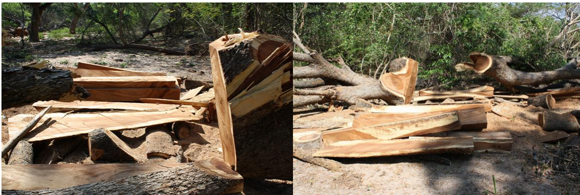
Figura 1. Deforestación sin control en la cuenca del río Cesar.

Un proyecto indispensable para mitigar algunas de los tensores de deforestación en la cuenca del río Cesar es ampliar la actual cobertura de gas natural domiciliario, este proyecto desestimula la generación del uso de leña y carbón vegetal.