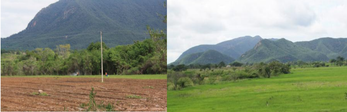
Figura 2. Actividades de agricultura en la parte norte del departamento del Cesar.

las consumen de forma acelerada, a el ataque de plagas como insectos, hongos y virus que encontrarían en un bosque poco diverso la oportunidad de dispersarse de forma muy rápida y una propagación efectiva para atacar toda la vegetación.