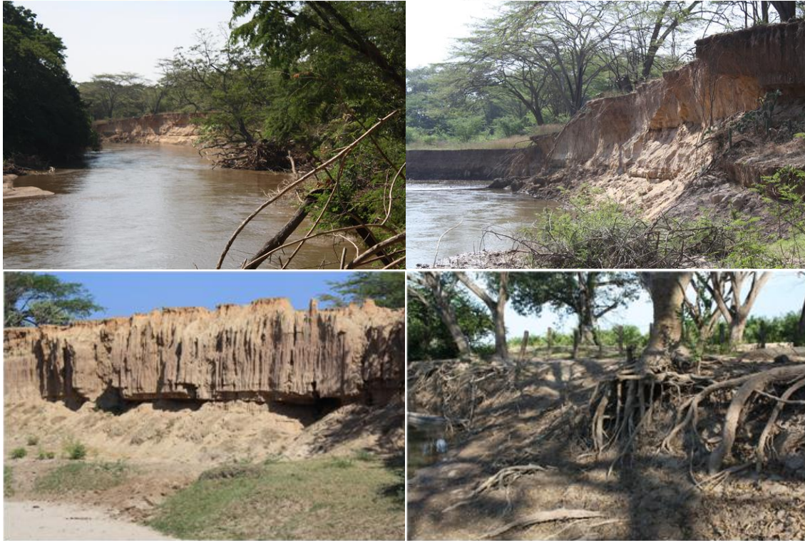
Figura 3. Problemas de infraestructura ubicada sobre las riberas del río Cesar.

Una de las actividades lícitas que incrementa la deforestación de las zonas de ribera lo representan los cultivos de palma, arroz, ganadería, cultivo de pasto entre otras actividades agrícola de la zona. La razón para que estas actividades se conviertan en un riesgo para la conservación de la vegetación de ribera y para la estabilidad del talud, lo representa la falta de compromiso de propietarios por acatar normas ya establecidas en el territorio nacional que definen como zona intangible la vegetación de la ribera o de la ronda hidráulica en una franja de aproximadamente 30m desde la máxima cota de inundación del canal del río, como se aprecia en la Figura 4. Igualmente falta de un programa de seguimiento y control de las autoridades para evitar la invasión de este espacio de amortiguación del río, ante este panorama actualmente se requiere de un plan de saneamiento y restauración de zonas de riberas en todas las zonas de la cuenca del río Cesar.