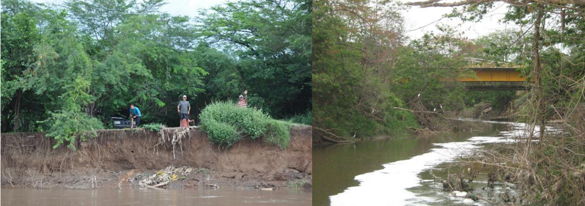
Figura 7. Actividad de botar basuras y vertimientos a las aguas del río Cesar.

Otro aspecto importante de considerar en relación a la contaminación es el uso del río como receptor de residuos sólidos de las comunidades aledañas que no tienen un adecuado manejo de las basuras y sistema de recolección y disposición final adecuada.