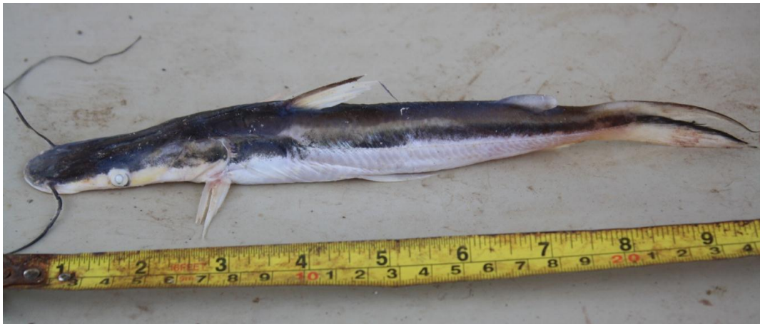
Figura 9. Individuo de bagre ( Sorubim cuspicaudus ) capturado sin alcanzar la madurez sexual y los cuales son comercializados como cacharro (varios individuos de diferentes especies muy pequeños).

A nivel de peces, la situación es crítica, la reducción de los caudales ecológicos, la sequias prolongada, la destrucción del talud natural, la incorporación de estructuras artificiales para regular inundaciones, la contaminación del agua esta diezmando las poblaciones, esta situación se suma el incremento en el número de familias que aprovechan el recurso pesquero de la zona, el uso de métodos inadecuado de pescas, el bajo o nulo control que se ejerce en la zona sobre las tallas y periodos de veda a la extracción de algunas especies. Durante el estudio se pudo registrar mas de 4000 unidades pesqueras en la zona media y baja de la cuenca, estas además de exageradas en el número, el tipo inadecuado de aparejo o sistemas de captura y su ubicación en los hábitats de migración, anidación y refugio de juveniles de las especies son condiciones que atentan contra la posibilidad de un manejo adecuado del recurso pesquero de la zona, donde la mayoría de las especies ícticas capturadas no han alcanzado la madurez sexual (Figura 9).