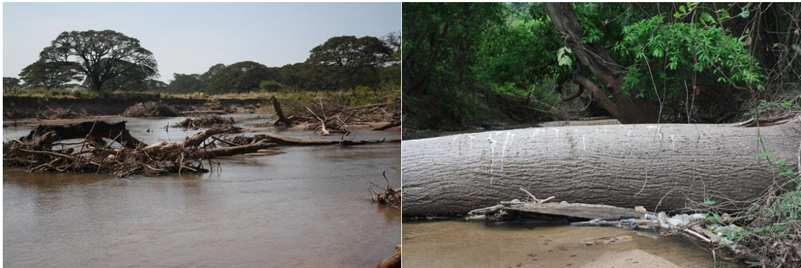
Figura 5. Diques y acumulación de troncos que taponan el normal curso del río Cesar.

La deforestación de la cuenca se realiza de manera indiscriminada sin que exista un modelo de dinámica que permita la mitigación de los efectos de avalanchas y escurrimientos rápidos o de pulsos extremos. Esto ha generado mayor movilidad e incremento de arrastre de sedimentos y acumulación en algunos sectores creando un alto riesgo de avalancha, en estos sectores se acumulan además material vegetal que produce una mayor vulnerabilidad de los sectores periféricos y de las poblaciones aguas abajo (Figura 5). Ante este problema es necesario desarrollar proyectos de manejo y control de estos diques naturales y temporales, los cuales se pueden lograr con participación comunitaria y una propuesta alternativa para el uso y aprovechamiento del material vegetal que es arrastrado por las inundaciones.