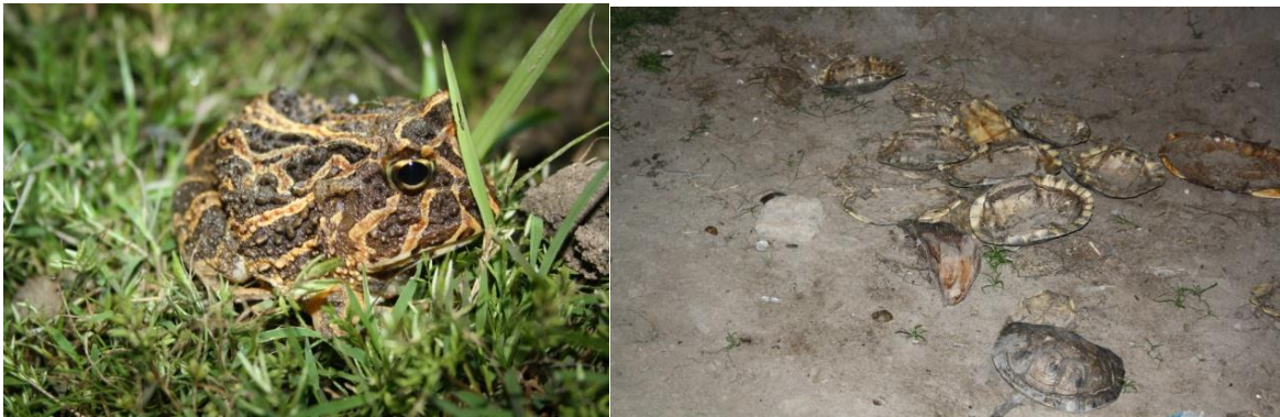
Figura 10. Anuro endémico de la región Caribe y actividad de consumo de hicotea especie endémica de la cuenca del río Magdalena en áreas de las Pitillas (Cesar)..

Específicamente la aplicación de un Plan de Ordenamiento y Manejo de la cuenca del río Cesar además de regular la minería de arena, controlar la erosión y contaminación del río lo convertiría en un importante hábitat para poblaciones de especies acuáticas y anfibias reportadas para la zona; donde la gran mayoría de ellas son endémicas de la región Caribe o de la vertiente del río Magdalena las cuales ante los niveles de contaminación y perdida de cuerpos de agua de esta arteria fluvial; la cuenca del río Cesar es potencialmente una importante alternativa para su refugio y conservación destacando especies de peces, anuros, tortugas de ríos, babillas y caimanes; donde además de conservar su diversidad y potencial genético garantizaría su importancia económica para los pescadores y el sostenimiento en la calidad de vida a los pobladores de los alrededores del río.