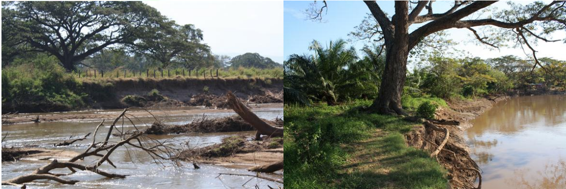
Figura 4. Cercas y cultivos ubicados en la rivera del río Cesar.

La deforestación de la cuenca se realiza de manera indiscriminada sin que exista un modelo de dinámica que permita la mitigación de los efectos de avalanchas y escurrimientos rápidos o de pulsos extremos. Esto ha generado mayor movilidad e incremento de arrastre de sedimentos y acumulación en algunos sectores creando un alto riesgo de avalancha, en estos sectores se acumulan además material vegetal que produce una mayor vulnerabilidad de los sectores periféricos y de las poblaciones aguas abajo (Figura 5). Ante este problema es necesario desarrollar proyectos de manejo y control de estos diques naturales y temporales, los cuales se pueden lograr con participación comunitaria y una propuesta alternativa para el uso y aprovechamiento del material vegetal que es arrastrado por las inundaciones.