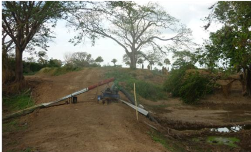
Figura 6. Sistema de bombeo de agua desde el río Cesar a una plantación.

Los niveles críticos del caudal ecológico del canal principal del río y de los tributarios, ha desarrollado una estrategia peligrosa por parte de los propietarios de predios colindantes del río, quienes generan desvíos a través canales artificiales (sequias), extracción de agua con bombas (Figura 6) y la construcción de diques o terraplenes, esta última alternativa es la más peligrosa por obstruir el paso del agua en el canal natural y desviar el cauce hacia los canales de riego de las fincas, estos terraplenes se hacen de forma artesanal con el uso de sacos de arenas o con maquinaria que construyen diques artificiales de arena. Esta actividad debe ser proscrita en la cuenca y recuperar los cauces naturales de tributarios y de los canales naturales de antiguos cauces que funcionan como amortiguadores de avalanchas e inundaciones (madreviejas).