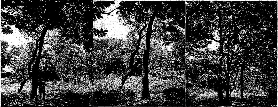
Arboles de las especies Caracol y Nin donde se observa las inclinación de sus fustes.

El informe se ilustró con las siguientes fotografías y en las cuales se pueden observar los ejemplares arbóreos a intervenir, algunas condiciones y el desarrollo de las actividades realizadas durante la diligencia: