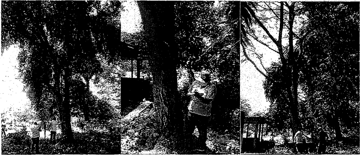
Arboles de las especies Uvito Brasileiro y campano, con su respectiva numeración.