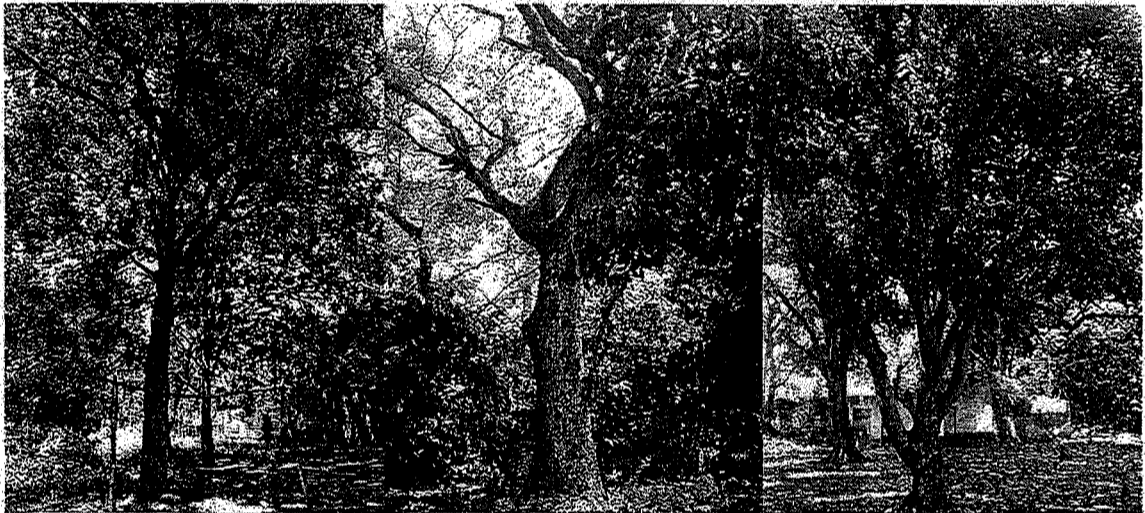
Arboles de las especies de Nin, Campano y Mango se puede observar el estado de estos