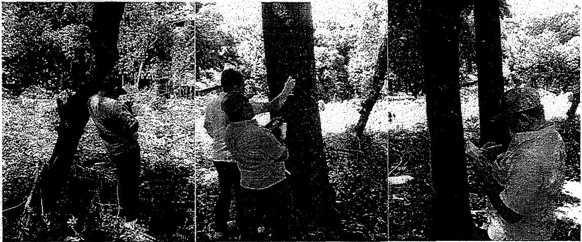
Actividades de toma de información, marcación de árboles de las especies Nin y Caracolí.