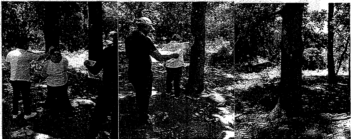
Actividades de toma de información, marcación de árboles de las especies Nin y Caracolí.