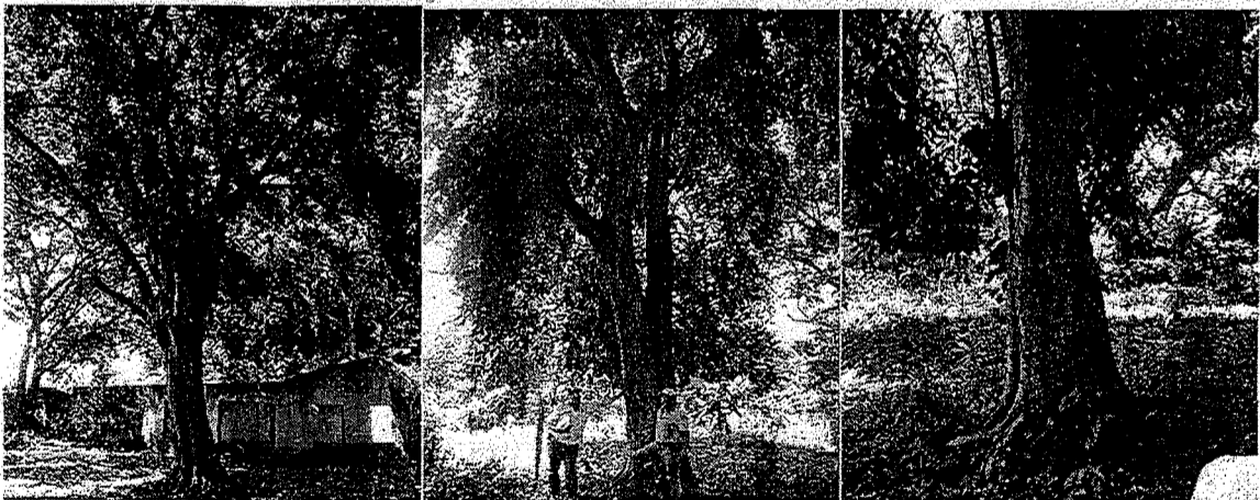
Arboles de las especies Mamón y Uvito Brasileiro, se puede observar su estado.