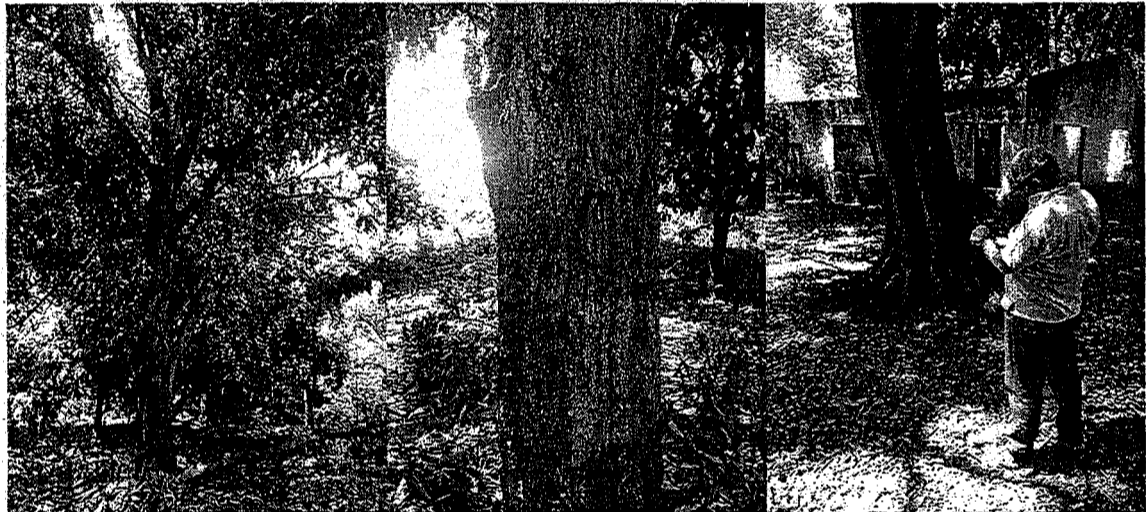
Arboles de las especies mango y Mamon se observa su estado y numeración.