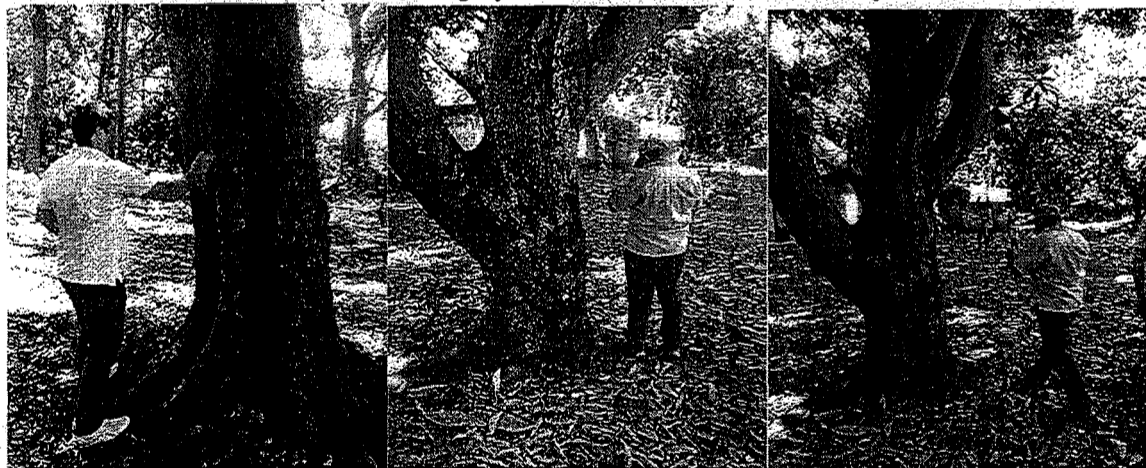
Arboles de las especies Mamon y Mango se observa su estado y numeración.

www.corpocesar.gov.co Km 2 Vía a La Paz- Lote 1 U.I.C. Casa e' Campo frente a la feria ganadera Valledupar - Cesar Teléfonos +57- 5 5748960 018000915306 Fax: +57 -5 5737181