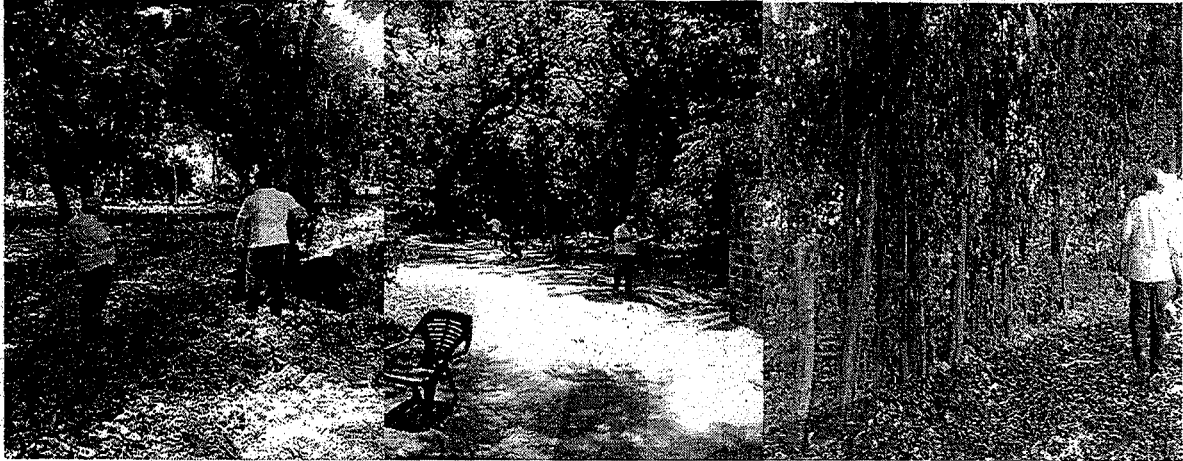
Actividades de toma de información y recorrido por el lote durante la visita.