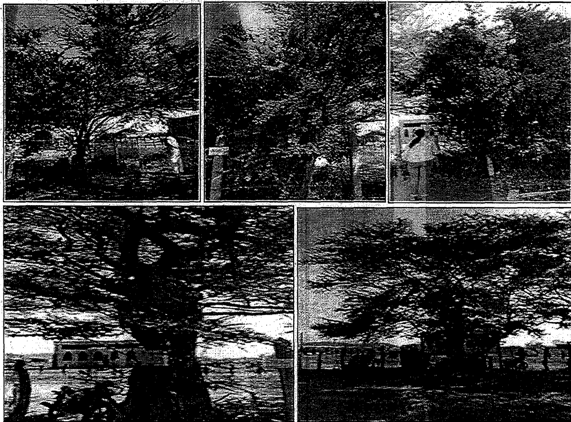
Imágenes 2, 3, 4, 5, 6, 7 y 8. Árboles objeto de solicitud de erradicación.