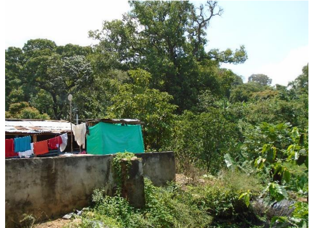
Imágenes 1,2,3 y 4. Registro fotográfico del árbol de la especie Caracolí.

A unos 300 metros aproximadamente del árbol de Caracolí, se encuentra plantado un árbol de la especie Pionio ( Erythrina poeppigiana ), adulto, corpulento, con más de 50 años de vida (según el funcionario de la Umata, acompañantes de la diligencia), en buen estado fitosanitario.