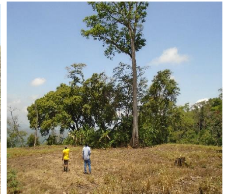
Imágenes 5, 6, y 7. Registro fotográfico del árbol de la especie Pionio.