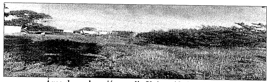
Área de exploración predio Universidad Nacional

El sitio donde se tiene prevista la exploración de agua subterránea se encuentra en un predio ubicado en la zona rural, con matrícula inmobiliaria No. 190-129915 (folios 25 y 26), en jurisdicción del municipio de La Paz Cesar, teniendo este una extensión superficial de 50 Has.