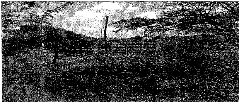
Área de exploración predio de la parcelación El Toco

El sitio donde se tiene previsto la exploración de aguas subterráneas se encuentra en un predio ubicado en la parcelación El Toco ubicado en zona rural del corregimiento de Los Brasiles, cuya georreferenciación está consignada en la Constancia suscrita por la Alcaldesa municipal de San Diego Cesar (folio 84), en jurisdicción del municipio en mención.