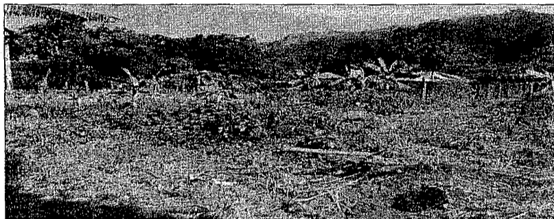
Área de exploración predio de matrícula inmobiliaria No. 190-140280

El sitio donde se tiene previsto la exploración de aguas subterráneas se encuentra en un predio ubicado en la vereda Los Manguitos, zona rural del municipio de Codazzi Cesar, cuyos linderos están consignados en el certificado de tradición y libertad con matrícula inmobiliaria No. 190 - 140280 (folios 83 al 84) con una extensión superficial de 33 Has 1731 M2, en jurisdicción del municipio en mención.