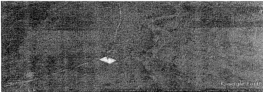
Georreferenciación del Área de Exploración