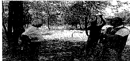
Foto 2. Acompañamiento del peticionario