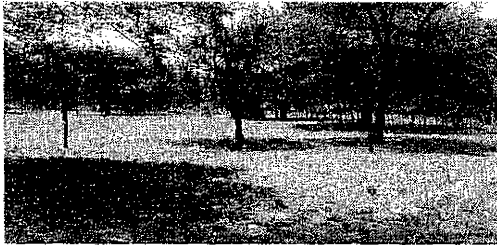
Foto 1. Área de exploración

Por lo anterior, la extensión del área a explorar se circunscribiría a un área aproximada de 385 metros cuadrados del predio rural objeto de la solicitud, área que actualmente se encuentra cubierta con pastos.