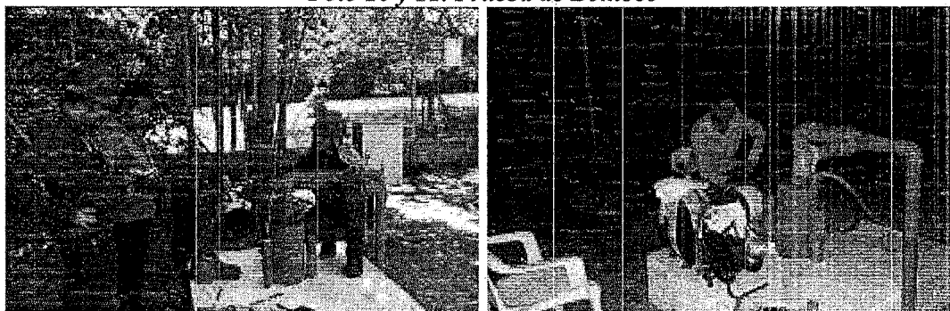
Foto 10 y 11. Prueba de Bombeo

Durante el desarrollo de la prueba de bombeo, el nivel dinámico de operación del pozo estuvo fluctuante entre la quinta y sexta hora de bombeo, oscilando entre los rangos de abatimiento comprendido de 18.48 m a 22.61m.