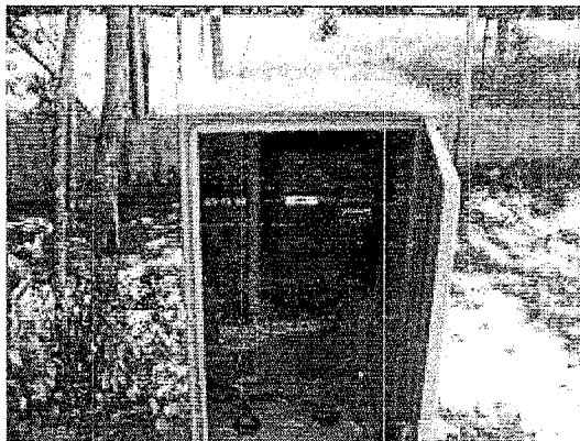
Foto 7. Variador de Caudal

Fundamentados en los resultados de los estudios Hidrogeológicos y de las características hidráulicas del pozo, establece un caudal de 0,5 l/s, como caudal a explotar del pozo, el cual se considera como máximo caudal a bombear.