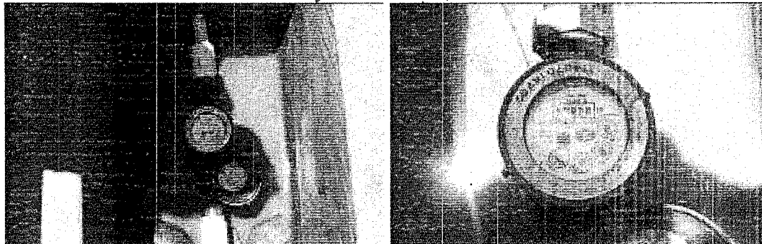
Foto 8 y 9. Medidor de Caudal

El pozo cuenta con un aparato de medición de caudal (contador acumulativo) marca ELSTER H 4000P de 2" de 15m 3 /hr., instalado en la tubería de descarga del pozo.