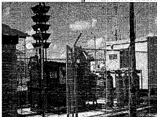
Foto 3. Plante de Tratamiento de aguas Potable PETRONORTE S.A.

En las instalaciones de la empresa PETROLEOS DEL NORTE S.A. en Jurisdicción del Municipio de San Alberto, se halla una planta de tratamiento de agua potable, la cual se encuentra georreferenciada con las coordenadas geográficas MAGNA – SIRGA: N 07°47'04,9" – W 73°23'59.3" Altura: 122m s.n.m.