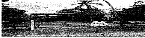
Foto 1. Acceso al predio La Unión

Continuación Resolución N° 1340 de 21 NOV 2016 por medio de la cual se otorga concesión para aprovechar las aguas de la corriente denominada Quebrada La Llana, para obras de rehabilitación y/o mejoramiento del tramo La Palma La Llana ubicado en jurisdicción del Municipio de San Alberto-Cesar, a nombre de CONSTRUCCIONES EL CONDOR S.A. con identificación tributaria No 890922447-7