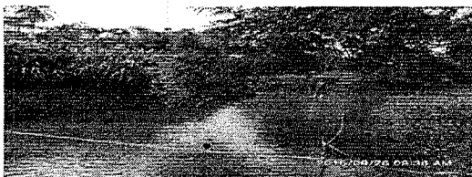
Foto 3. Sitio aforo quebrada La Llana