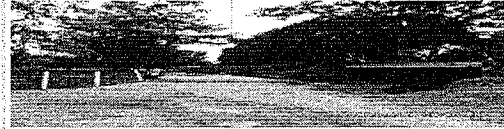
Foto 2. Puente línea férrea cerca al predio