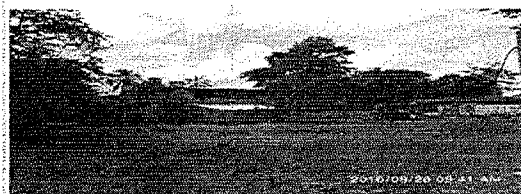
Foto 4. Vivienda principal predio La Unión

f) SI EXISTEN POBLACIONES QUE SE SIRVEN DE LAS MISMAS AGUAS PARA LOS MENESTERES DOMÉSTICOS DE SUS HABITANTES O PARA OTROS FINES QUE PUEDAN AFECTARSE CON EL APROVECHAMIENTO QUE SE SOLICITA.